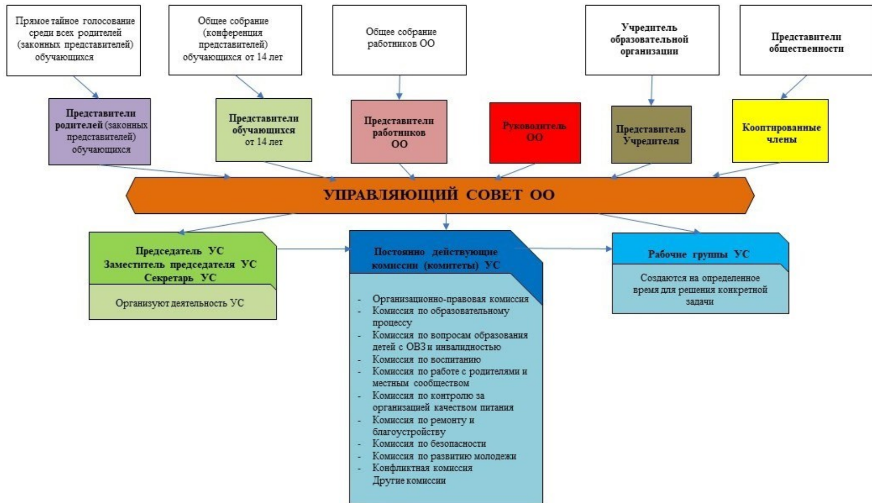
Рис. 1. Модель № 1 – «Управляющий совет общеобразовательной организации» (УС ОО)